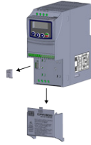
(a) Removal of the accessory and connection protection covers (XC4) from the IO expansion (a) Remoción de las tapas de accesorios y de protección de la conexión (XC4) de la expansión de IO's

(a) Remoção das tampas de acessórios e de proteção da conexão (XC4) da expansão de IO's