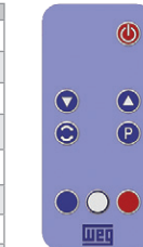
Figure 1: Controle remoto (infravermelho)

(*) Função disponível quando existe aplicativo SoftPLC instalado. Caso contrário, essa tecla não possui nenhuma funcionalidade. (**) Modo de navegação no display do CFW300 somente disponível através do controle remoto quando motor estiver parado.