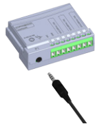
(c) IR receiver connection (c) Conexión de receptor IR (c) Conexão do receptor IR

Figure A1: (a) to (c) Installation of accessory