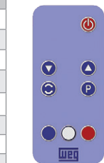
Figure 1: Control remoto (infrarrojo)

(*) Función disponible cuando existe aplicativo SoftPLC instalado. En caso contrario, esta tecla no posee ninguna funcionalidad.